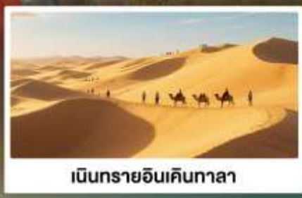
เนินทรายอินเคินทาลา