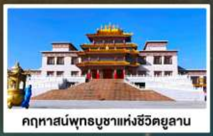
คฤหาสน์พุทธบูชาแห่งชีวีตยูลาน

🏠 พักโรงแรมพื้นเมือง แบบกันสับย มีห้องน้ำมิดชิด