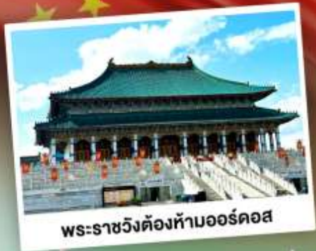
พระราชวังต้องห้ามออร์ดอส

ตะลุยเป็นทรายเป็นร้อยเพลง แห่งมองโกเลียใน ชมวิวทุ่งหญ้าโล่งกว้างตัดขอบฟ้าคราม