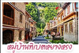
หมู่บ้านทิเบตเซียงแดง

ตะลุยเจียงคู คูหิมะถ้ำกุ๋ปิงชาน ชมเข็ชอิมแพนด้ายักษ์ พักใจที่หอดน้ำตาสีฟ้า! แวะชิลเมืองโบราณลี่ไต สัมผัสสมมติเล่นหิมะ หมู่บ้านทิเบตทางหลวงชาโต สัมผัสความหนาวเย็นที่ อุทยานสวรรค์ธารน้ำแข็งถ้ำกุ๋ปิงชาน แหล่งรวมวิวหลักล้าน ตื่นตาไปกับแสงสียามค่ำคืน หอดน้ำตาสีฟ้า ณ สะพานหนานเฉียว เมืองดูเจียงเยียน ก่อนปิดท้ายด้วยการช้อปปิ้งจุใจ ถนนช้อปปิ้ง-ทุ่กุ๋หลี่ และเซกาฟกั๊บ แพนด้ายักษ์ สุดคิวท์