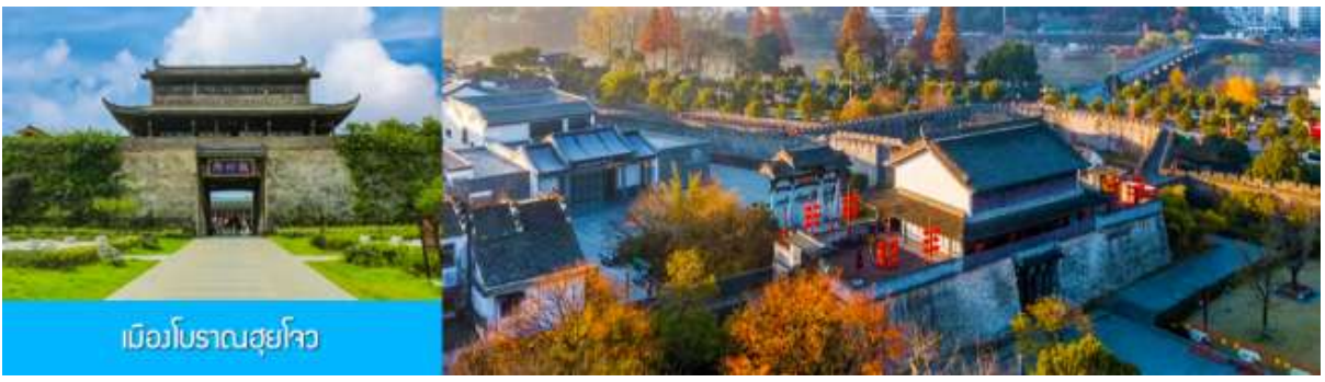
เมืองโบราณซูโจว

เที่ยง รับประทานอาหารกลางวัน ณ ภัตตาคาร (10)