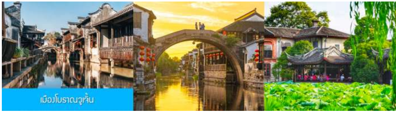
เมืองโบราณวูเจิ้น