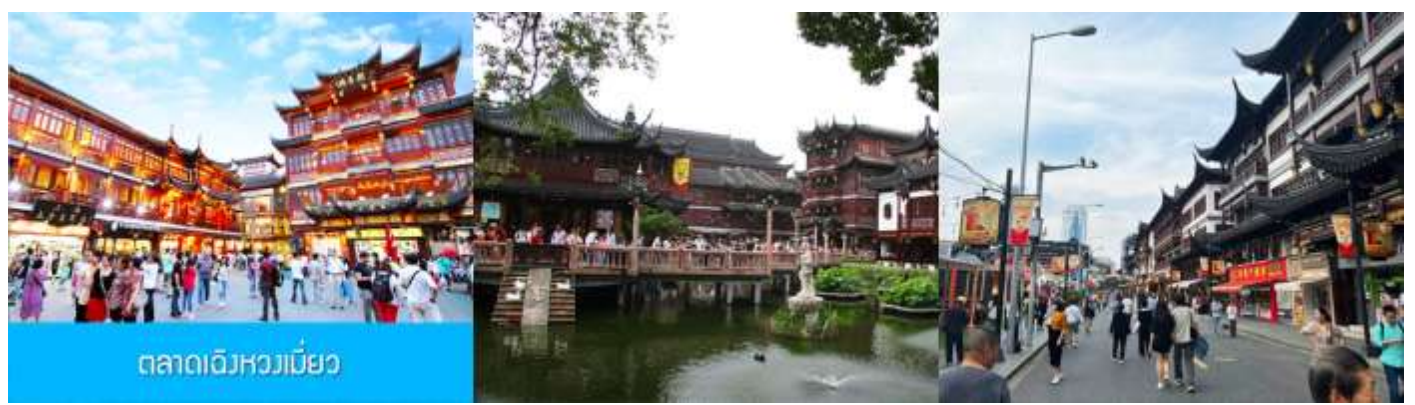
ตลาดเฉิงหวงเมี่ยว

เช้า รับประทานอาหารเช้า ณ ห้องอาหารของโรงแรม (6)