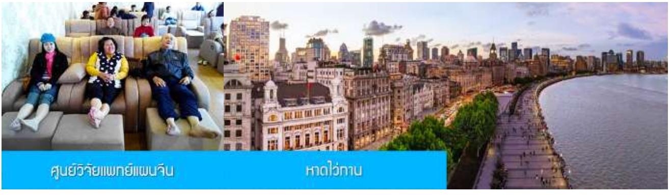
ศูนย์วิจัยแพทย์แผนจีน