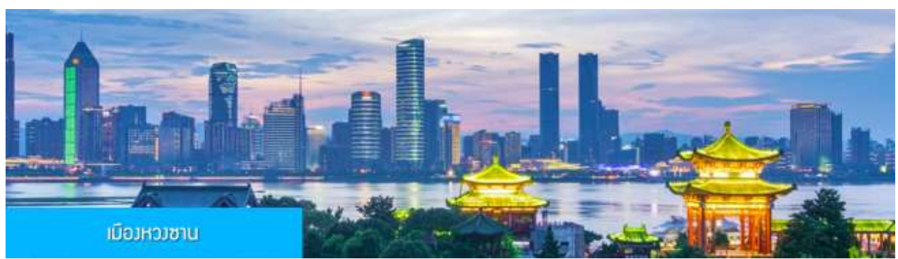
เมืองหวงชาน

ทางบริษัทฯ ขอสงวนสิทธิ์ในการสลับโปรแกรมทัวร์ตามความเหมาะสมขึ้นอยู่กับสถานการณ์หน้างาน โดยยึดถือผลประโยชน์ของลูกค้าเป็นสำคัญ