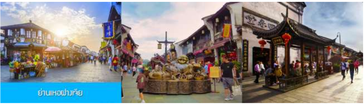
ย่านเหอฝางเจี๋ย