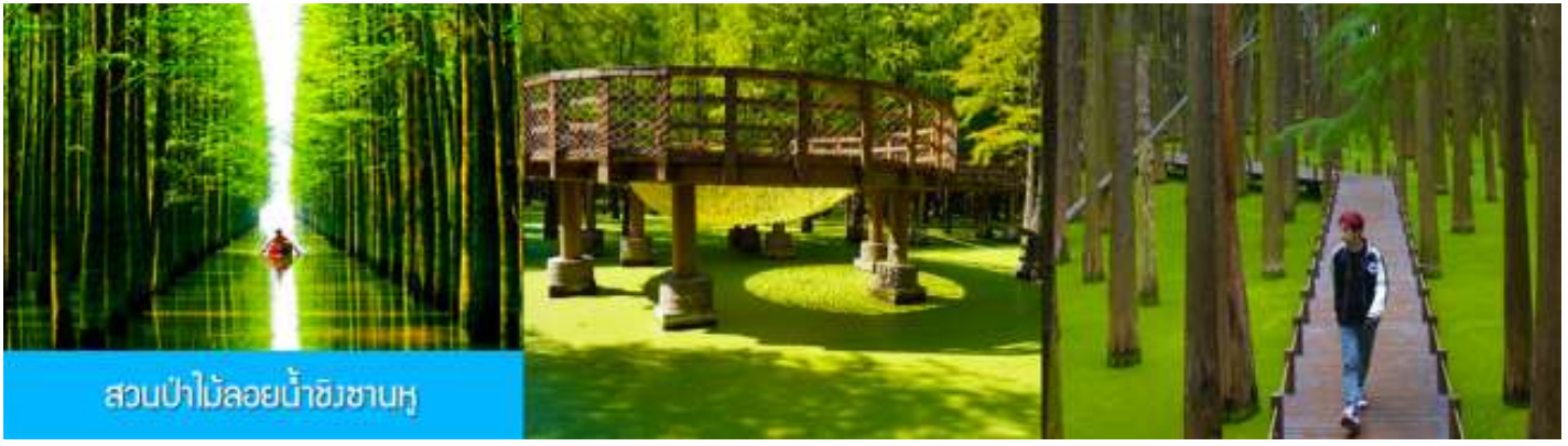
สวนป่าไม้ลอยน้ำชิงชานหู

เช้า รับประทานอาหารเช้า ณ ห้องอาหารของโรงแรม (1) หลังอาหารนำท่านเดินทางโดยรถบัสสู่เมืองหลิงอัน 临安市 (ระยะทาง 175 กม. ใช้เวลาเดินทางราว 2 ชั่วโมงเศษ)