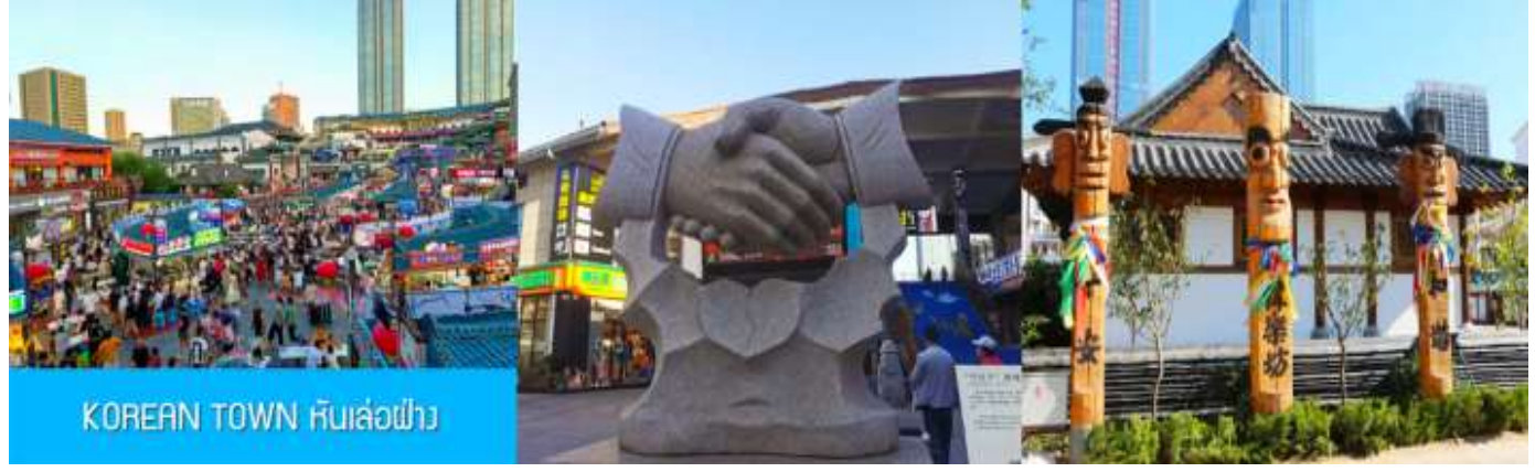
KOREAN TOWN หันเล่อฝ่าง