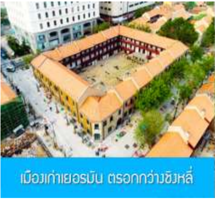
เมืองเก่าเยอรมัน ทรอกกว่าวซังหลี่