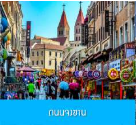
ถนนางซาบ