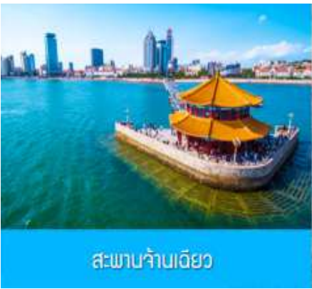
สะพานจ้านเจียว