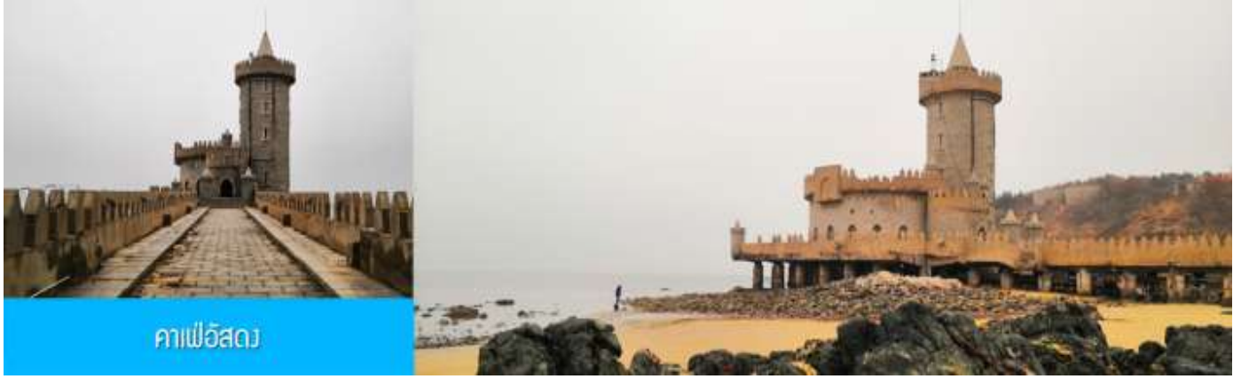
คาเฟ่อีสถ

จากนั้นนำท่าน เดินทางสู่ คาเฟ่อีสถ 落日古堡 นำท่านชมปราสาทในเทพนิยาย ที่ตั้งตระหง่านอยู่ริมชายหาด นานาชาติเว่ยไห่ คาเฟ่ที่ออกแบบด้วยสถาปัตยกรรมสไตล์ยุโรป ตัดกับวิวทะเลสีคราม และที่นี่คือแม่เหล็กดึงดูดนักท่องเที่ยวมาเก็บบรรยากาศความสวยงามความโรแมนติก (ตัวปราสาทเป็นร้านกาแฟ หากท่านต้องการเข้าไปด้านใน ต้องจ่ายค่าเครื่องดื่ม ตามเมนูของทางร้าน ซึ่งไม่รวมในอัตราค่าทัวร์)