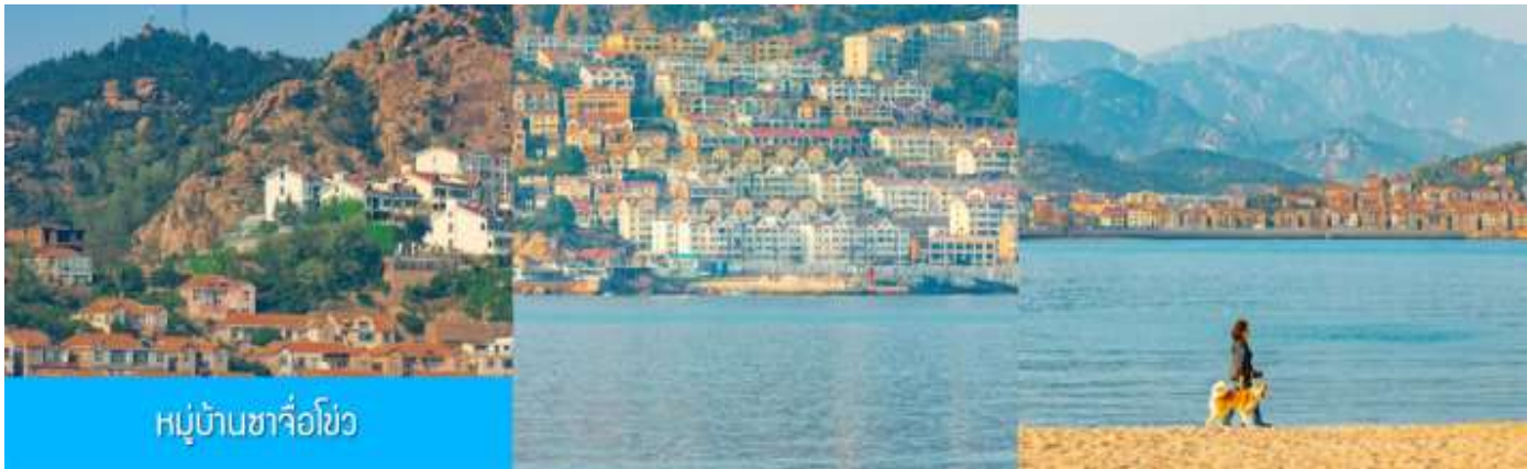
หมู่บ้านซาจื่อโข่ว

จากนั้นนำท่าน เดินทางสู่ คาเฟ่อีสถ 落日古堡 นำท่านชมปราสาทในเทพนิยาย ที่ตั้งตระหง่านอยู่ริมชายหาด นานาชาติเว่ยไห่ คาเฟ่ที่ออกแบบด้วยสถาปัตยกรรมสไตล์ยุโรป ตัดกับวิวทะเลสีคราม และที่นี่คือแม่เหล็กดึงดูดนักท่องเที่ยวมาเก็บบรรยากาศความสวยงามความโรแมนติก (ตัวปราสาทเป็นร้านกาแฟ หากท่านต้องการเข้าไปด้านใน ต้องจ่ายค่าเครื่องดื่ม ตามเมนูของทางร้าน ซึ่งไม่รวมในอัตราค่าทัวร์)