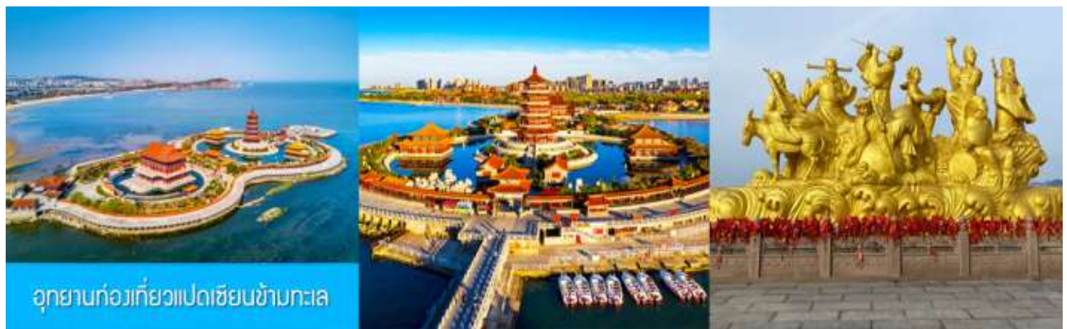
อุทยานท่องเที่ยวแปดเซียนข้ามทะเล