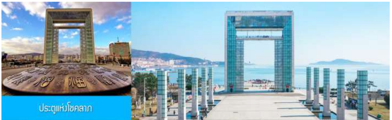
ประตูแห่งโชคกลาง