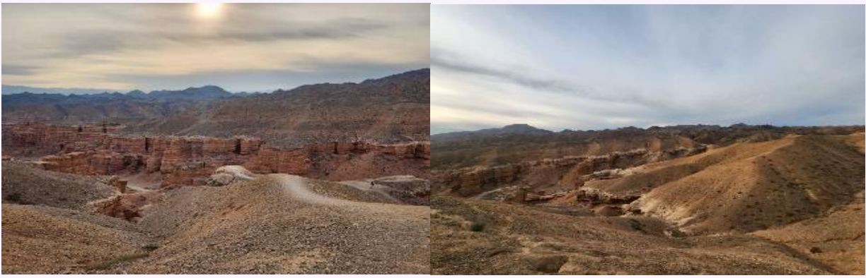
VALA42XJ-1 คาซัคสถาน ฉันทรักเธอ โคลโซ ชาริน 4วัน 2คืน BY XJ

จากนั้นนำท่านไปยัง อุทยานแห่งชาติ ชาริน แกรนด์แคนยอน (ใช้เวลาเดินทางประมาณ 3.30 ชม.) (ไม่รวมค่ารถเช่า-ออกประมาณ 15-20 USD) ท่านสามารถถ่ายรูปหรือเดินถ่ายรูปได้บริเวณด้านหน้าหรือบริเวณทางเดิน ชาริน แกรนด์แคนยอน ตั้งอยู่บนแม่น้ำชาริน (Sharyn River) ที่อยู่ติดกับชายแดนประเทศจีน แกรนด์แคนยอน ชาริน มีอายุถึง 12 ล้านปี แต่ละด้านมีความสูงตั้งแต่ 150 - 300 เมตร ชารินแคนยอนมีผาหินสูงชันที่มีสีไล่ระดับ ทำให้สถานที่แห่งนี้โดดเด่นพอๆ กับแกรนด์แคนยอนในสหรัฐฯ แกรนด์แคนยอน ชาริน ประกอบด้วยหุบเขาที่แตกต่างกัน 5 แห่ง ได้แก่ Valley of Castles , Temirlik Canyon, Yellow Canyon, Red Canyon และ Bestamak Canyon นอกจากนี้ยังมีหุบเขาหรือทางเดินเล็กๆ อีกหลายแห่ง รวมถึงหุบเขา Kurtogay