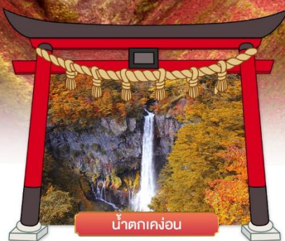
น้ำตกเคงอน