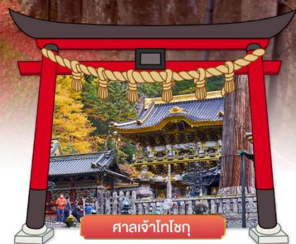
ศาลเจ้าโทโชกุ