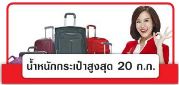
น้ำหนักกระเป๋าสูงสุด 20 กก.

**หากต้องการอัพเกรดที่นั่งรถกวนแจ็งเซลล์ที่ท่านติดต่อเพื่อทำการเช็คที่นั่ง อัตราการให้บริการดังนี้**